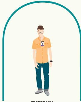
SECRETARIA O SECRETARIO

Con tu cédula de identidad aun vencida, ante la presidenta o presidente de la Mesa Electoral, para que registre tus datos en el Sistema de Autenticación Integrado.